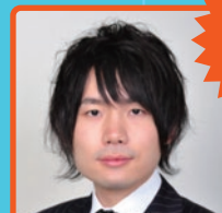
佐藤 天彦 八段