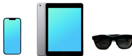
スマートフォン (QTモバイル)

リアルタイム音声翻訳 AI が利用可能なデバイスを出し出すサービスで、1 日単位の短期契約でご提供いたします。イベント時の訪日外国人対応や、海外出張での商談などにご利用ください。