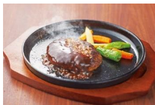
佐賀牛ハンバーグ