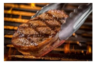
博多和牛ロースステーキ