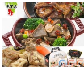
黒豚缶詰 5 缶セット