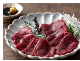
馬刺し赤身食べくらべセット