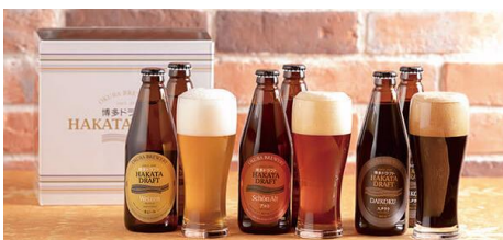
クラフトビール「博多ドラフト」