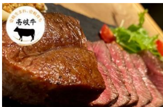
長崎県産高岐牛ミスジステーキ