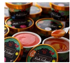
リッチジェラート/シャーベット

※出品予定となりますので、実際の出品とは異なる場合がございます。ご了承ください。