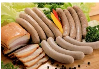
鹿児島黒豚ソーセージバラエティ詰合せ